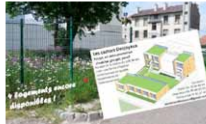
La petite fabrique de la ville durable : opération en auto-promotion dans l'éco-quartier Desjoyaux à Saint-Étienne

Le projet ALARIC se propose d'appréhender la nature et les principes de ce processus d'incrémentation du changement urbain par un décalage temporel de l'interrogation. Il est postulé que le basculement dans la société technicienne, qui se produit au cours du XIX e siècle, peut constituer un miroir heuristique des changements aujourd'hui en cours.