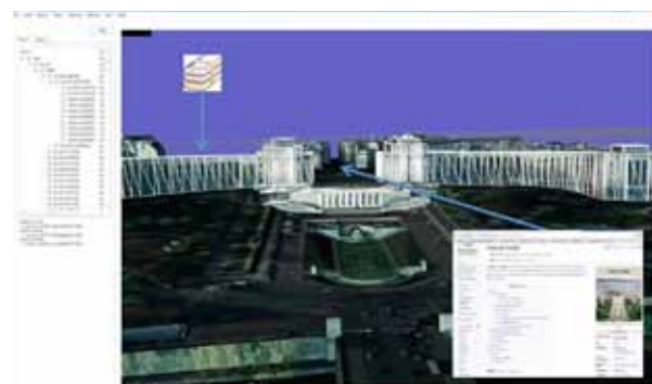
Une reconstitution 3D